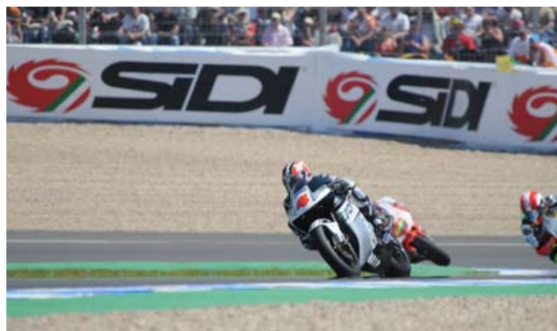
Aoyama, Simoncelli y Barberá ocuparon el podio de 250