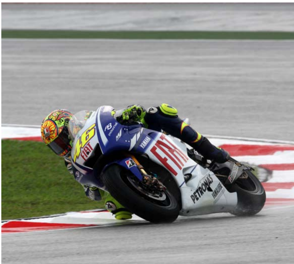
Valentino Rossi ganó su 9º Título Mundial bajo la lluvia de Sepang

Texto: Eva Ávila