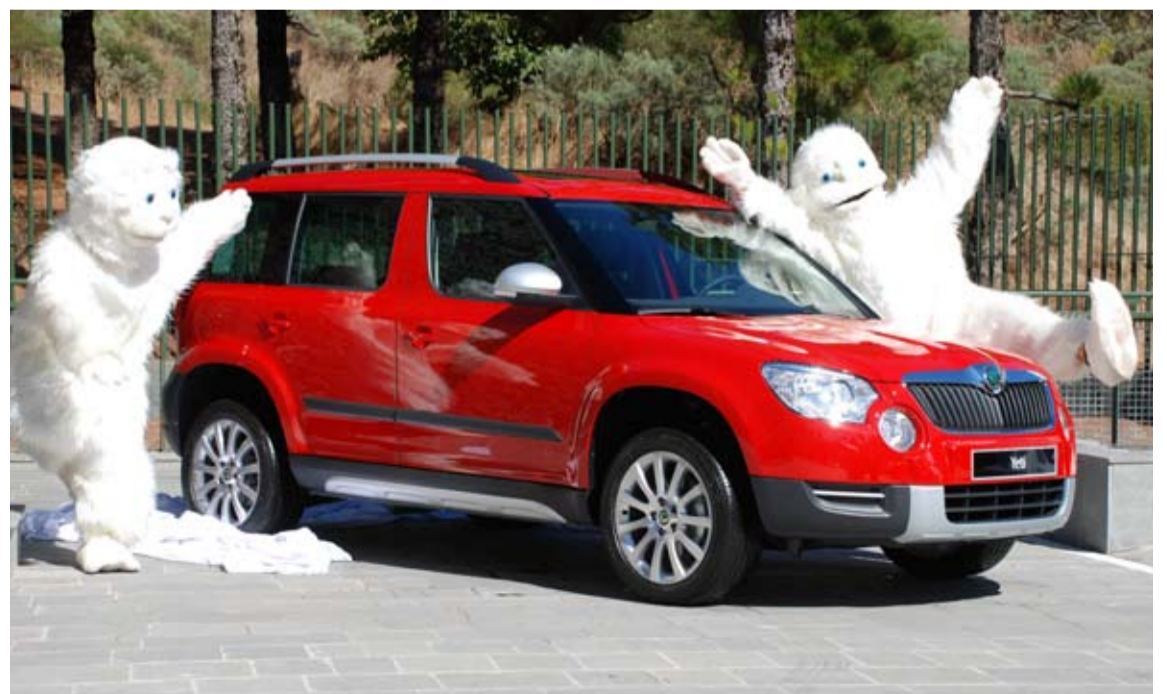
Motorizaciones: Dos motores de gasolina TSI 105 o 160 CV 4x4. Tres motores diesel TDI CR de 110, 140 4x4 y 170 4x4.