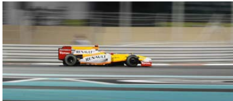
Alonso en su última actuación con Renault. Cambiará de colores.