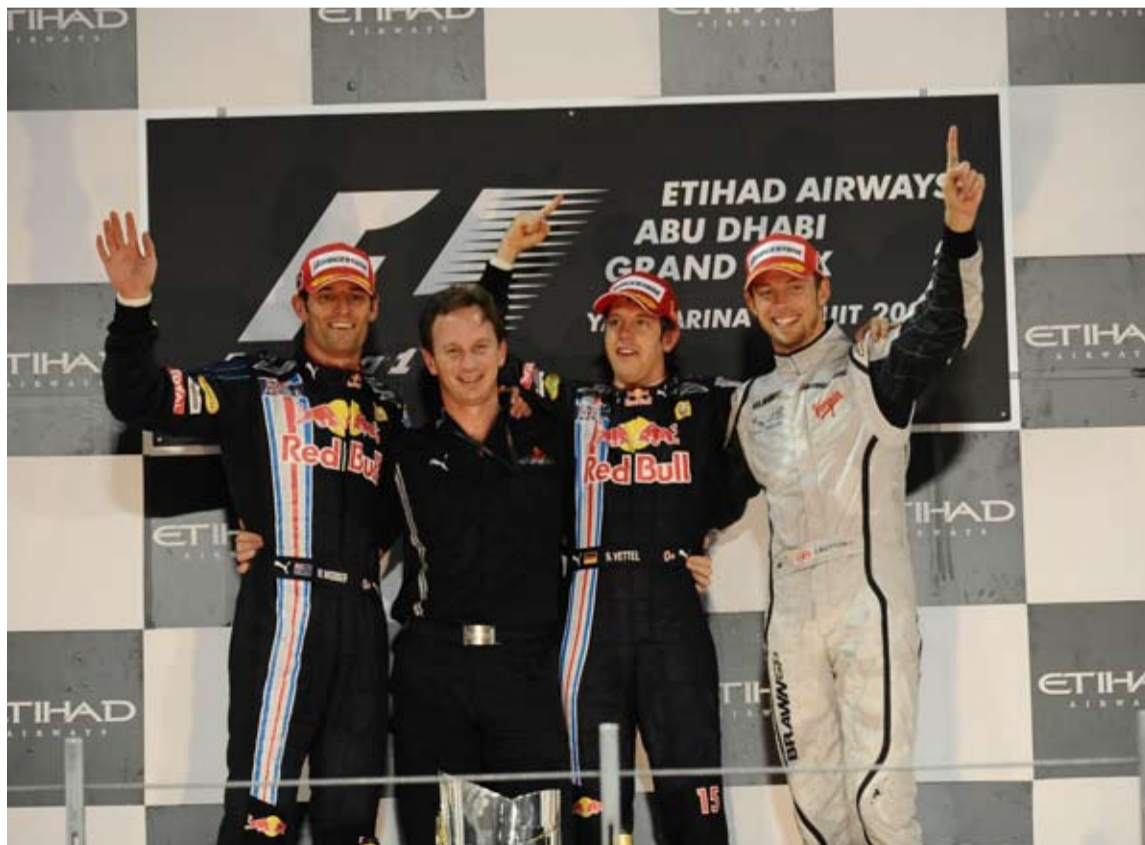
Doblete de RBR, con el Campeón 2009 Jenson Button como testigo excepcional en el tercer puesto del cajón.