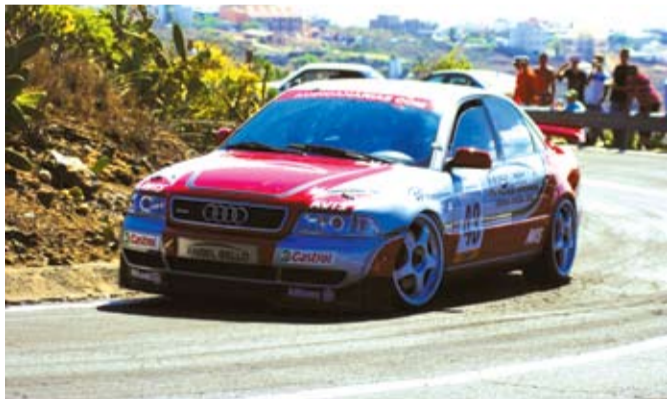
En carrozados el mejor volvía a ser Angel Bello con su Audi A4