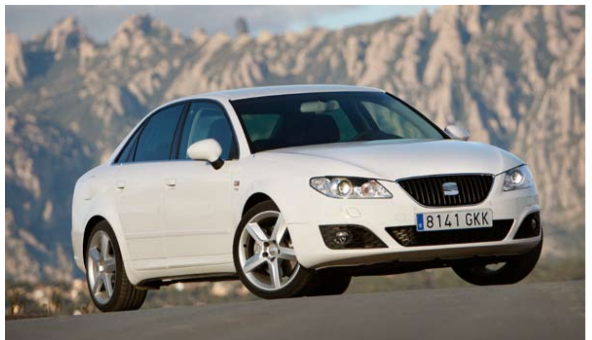
El Seat Exeo ha conseguido un valioso galardón: El Volante de Oro.