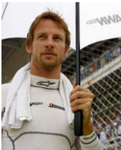
J. Button (F1)