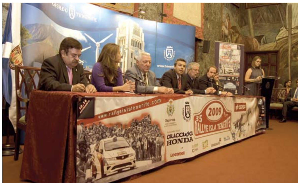
La presentación estuvo presidida por el Consejero de Deportes del Cabildo de Tenerife Don Dámaso Arteaga.