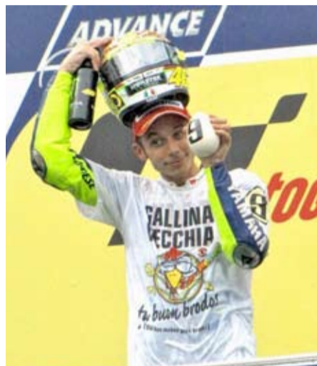
V. Rossi (MotoGP)