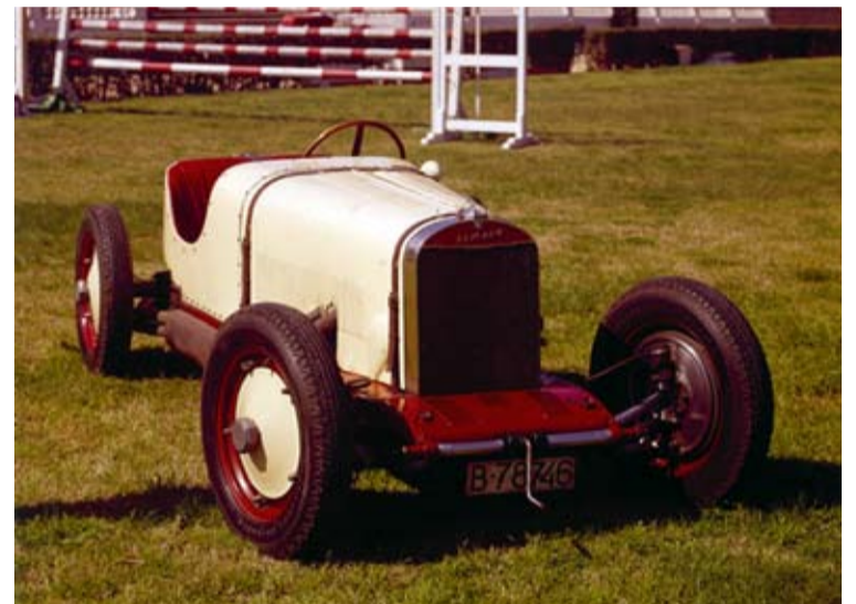
El último Nacional Pescara de Gran Premio.