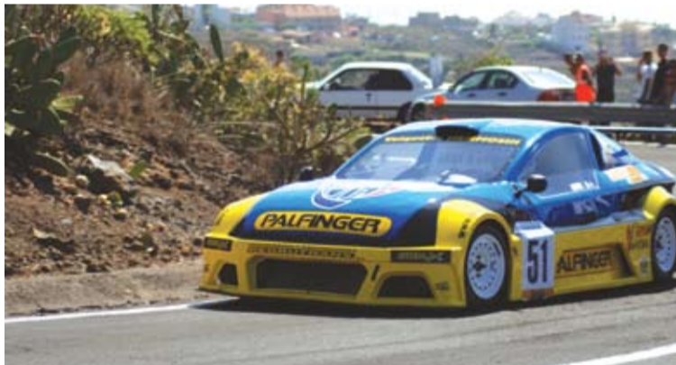
Pedro Javier Afonso se clasificó tercero