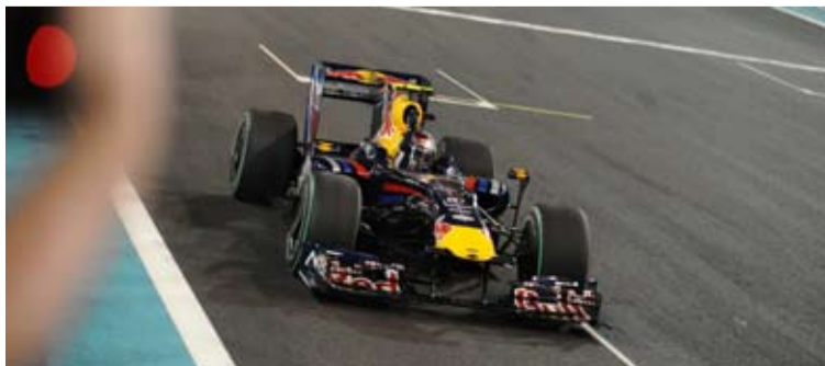
Sebastian Vettel acabó la temporada de la mejor manera: con una victoria.