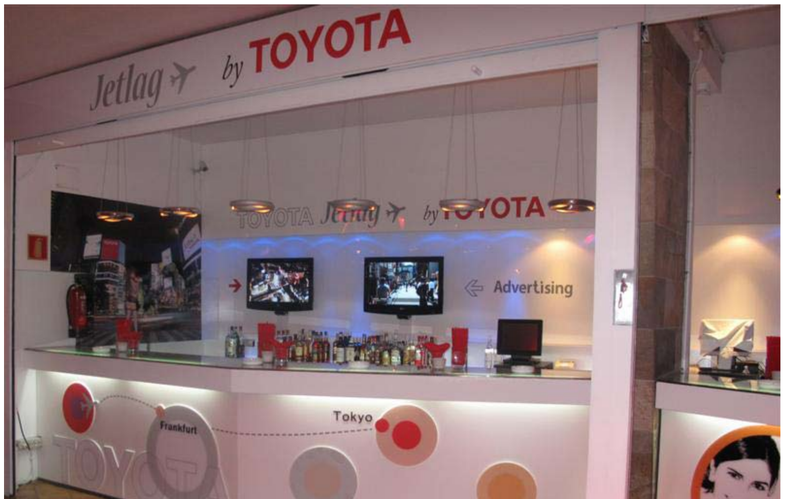
El proyecto, impulsado por el Laboratorio de Marketing de Toyota Canarias, refuerza los fructíferos acuerdos anteriores con el Grupo MB.