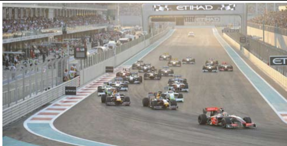
La última carrera de la temporada 2009 se celebró, sin sorpresas, en un escenario magnífico.

Novedades: Audi A5 Sportback; BMW X1 y Serie 5; Skoda Yeti; Toyota Urban Cruiser.