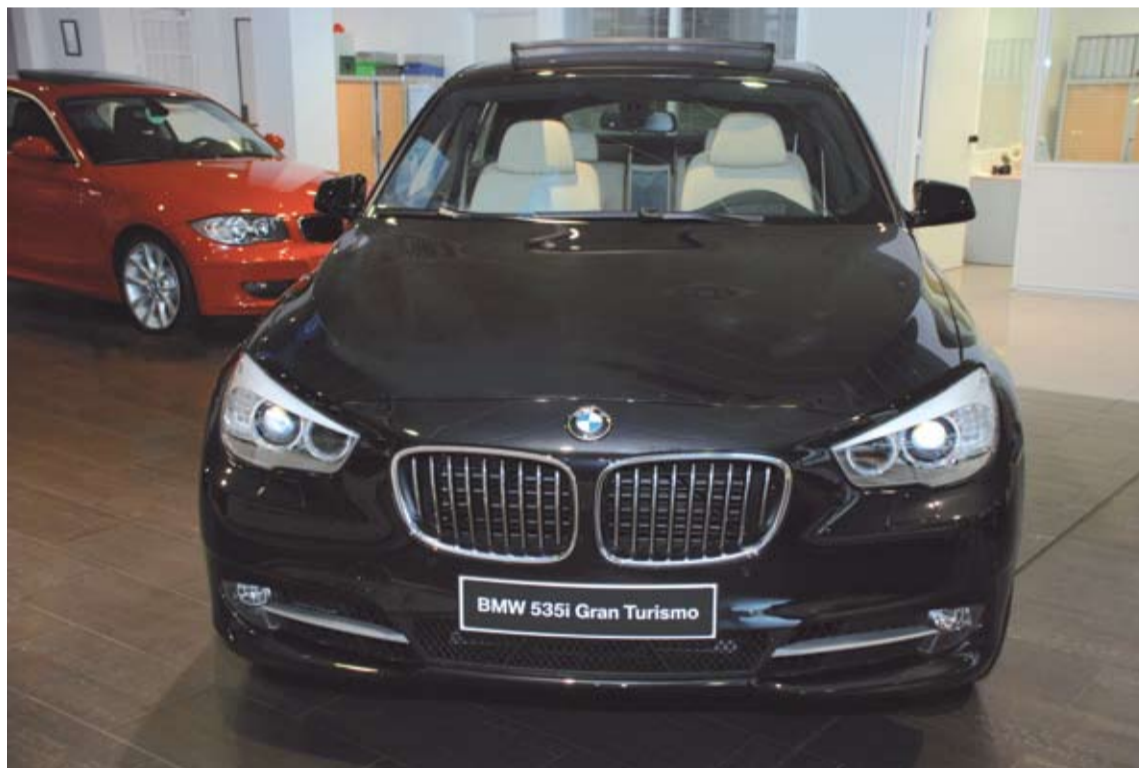
El BMW 535 es un gran turismo con todo lo necesario para ser considerado un deportivo.

Podríamos decir que el 535 es un gran turismo deportivo. Equipa un motor de 6 cilindros, 24 válvulas con una cilindrada de 2979 cc con una relación de compresión de 10,2 rinde una potencia de 306CV a 5.800 rpm. Acelera de 0 a 100 en 6,3 segundos es capaz de alcanzar los 250 Km/h. El consumo medio ponderado, según el fabricante, es de 8,9 l a los 100.