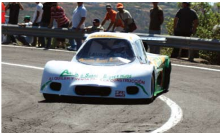
Lauren, con el Campeonato en el bolsillo, se conformó con la segunda plaza.