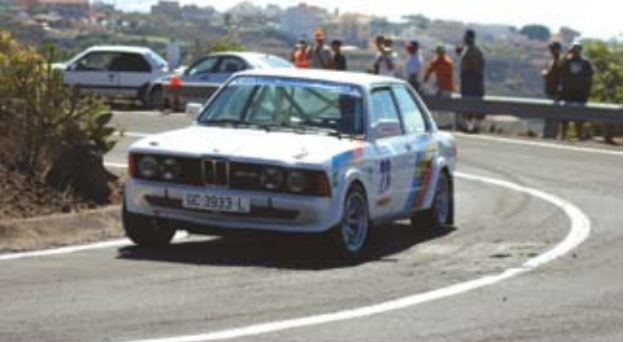
Pedro Castilla vencedor del Gr 1/H