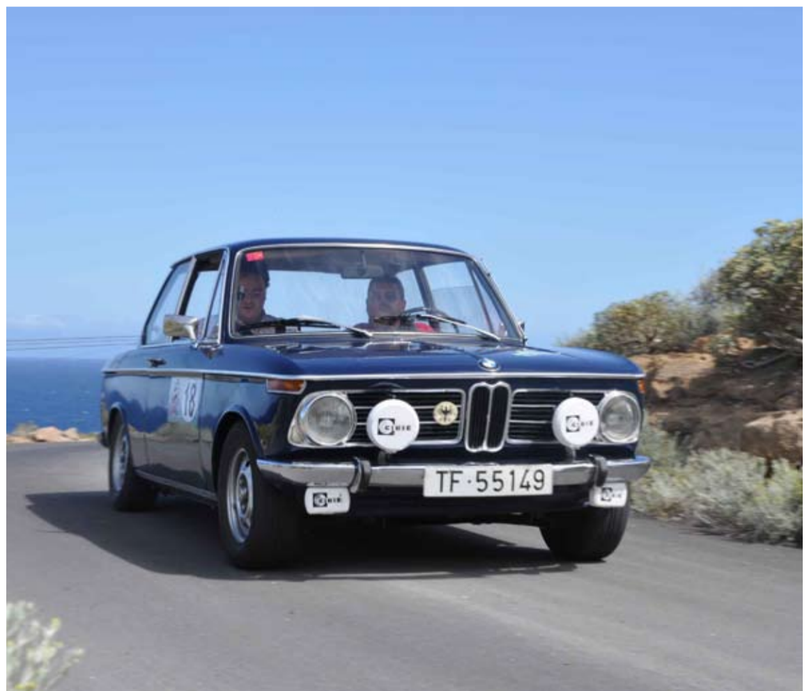
La prueba, programada en principio para noviembre, se cambia a diciembre para no coincidir con otros eventos del motor.