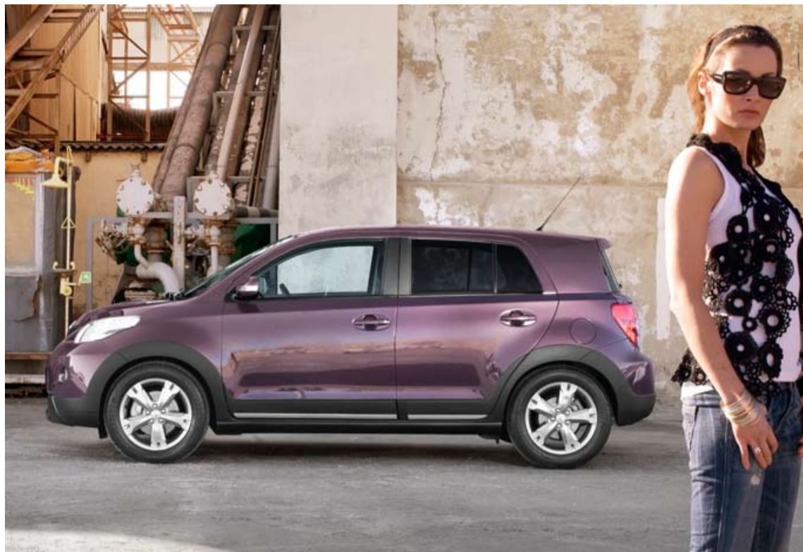
El Toyota Urban Cruiser es un vehículo compacto, un SUV diferente.

La configuración disponible tiene una motorización de 1329 cc, con una potencia máxima de 101/6000 (Cv/rpm) y un par motor máximo de 132/3800 Nm/rpm, alcanzando una velocidad máxima de 175 Km/h, con una acelera-