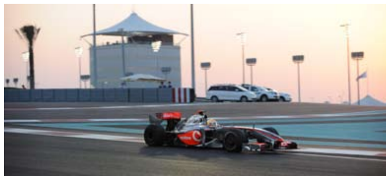
Hamilton que partía desde la pole tuvo problemas mecánicos y abandonó.