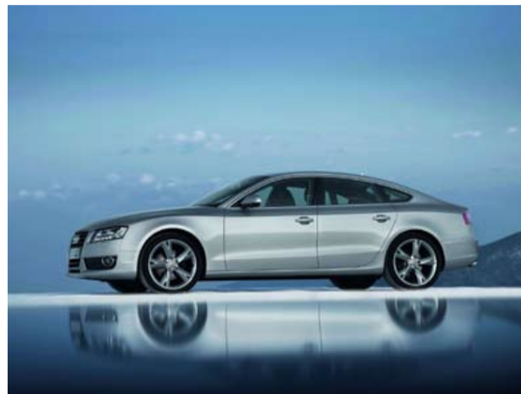
Su elegante diseño le confiere un aspecto muy deportivo.

Audi Canarias también ofrece en el A5 Sportback, en todas sus motorizaciones, el paquete deportivo S line. Sus principales componentes son sus llantas de 18 pulgadas, asientos delanteros deportivos, tren de rodaje deportivo S line, inserciones en aluminio mate cepillado, molduras de entrada en los bordes de las puertas, entre otras cosas.